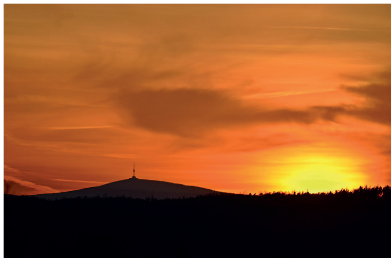
Zwycięskie zdjęcie z kategorii JESIEŃ-ZIMA