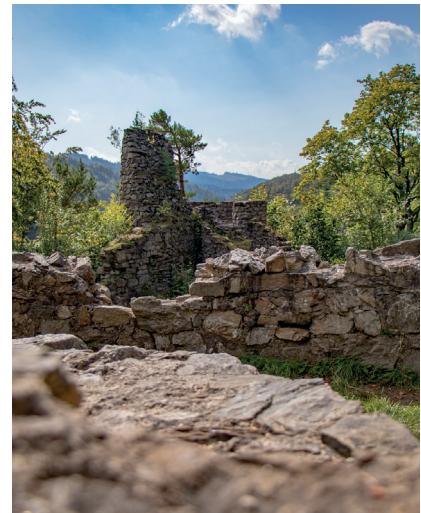
Wirtualne zwiedzanie: Ruiny zamku Rychleby