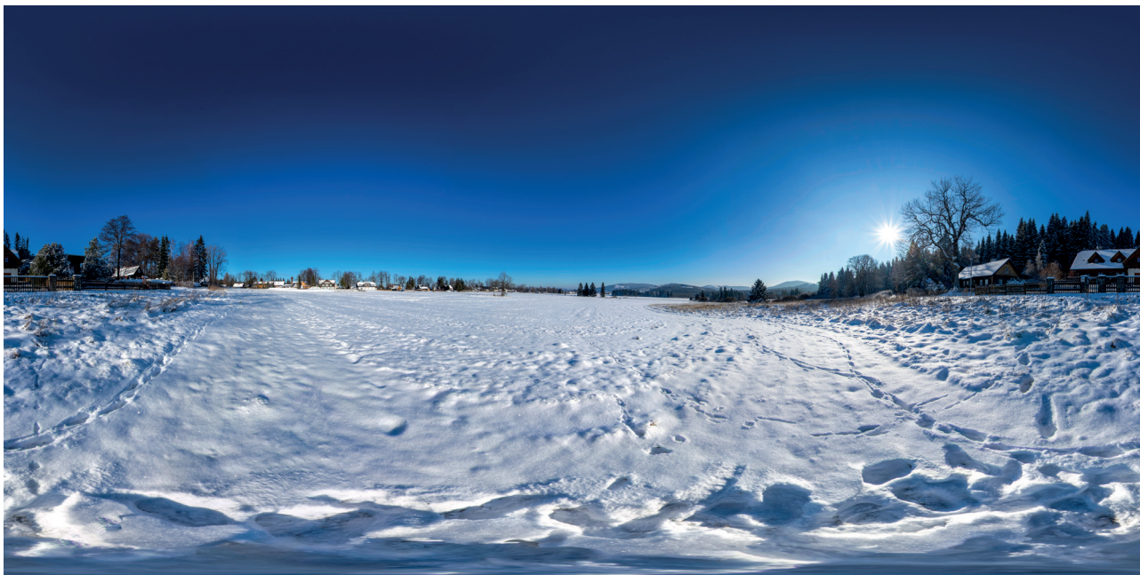
Przykład zdjęcia 360°. Rejvíz - ścieżka dydaktyczna prowadząca do Wielkiego Jeziorka Mchowego.

Mapa zawiera również możliwość Wirtualnego zwiedzania. Są to serie zdjęć, które przedstawiają widok 360° danego miejsca, tak, aby wirtualny odwiedzający mógł się swobodnie rozglądać za pomocą urządzenia mobilnego lub myszy. Zdjęcia są ze sobą połączone punktami, dzięki czemu można przechodzić do innych części danej lokalizacji.