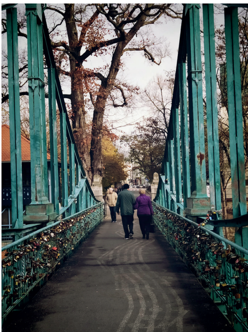
Zwycięskie zdjęcie z kategorii JESIEŃ-ZIMA

Dziękujemy wszystkim uczestnikom i gratulujemy zwycięzcom.