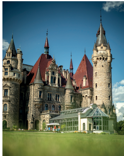
Wirtualne zwiedzanie: Zamek Moszna