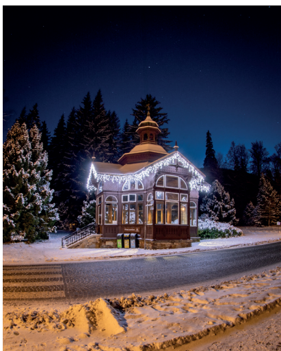
Virtuální prohlídka: Karlova Studánka