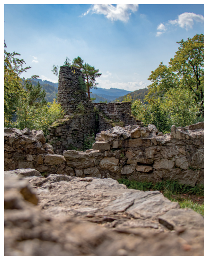
Virtuální prohlídka: Zřícenina hradu Rychleby